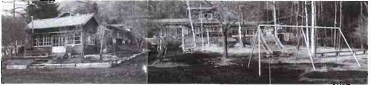
・平成 12 年 6 月に移転新築前の軽井沢治育園の全容写真。撮影推定時期：昭和 40 年代。